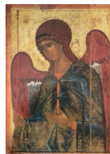
tavola 24x32 (int. 20x27) oppure 30x40 (int. 25x34)

da un'icona costantinopolitana del XIV sec.