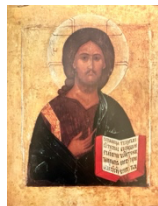
tavola fornita dalla scuola