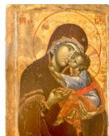
tavola 24x32 (int. 20x27) oppure 30x40 (int. 25x34)