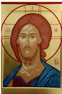
Volto di Cristo