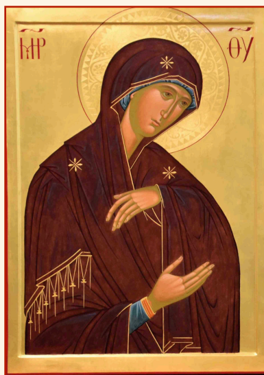
Madre di Dio della Deesis

La pratica di quest'arte è pertanto espressione di una nuova unità che le Chiese stanno ricostruendo in Cristo.